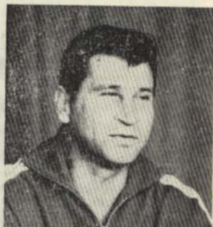
Змс и заслужил треньор — старши треньор на представителния футболен отбор на ЦСКА «Септемврийско знаме»